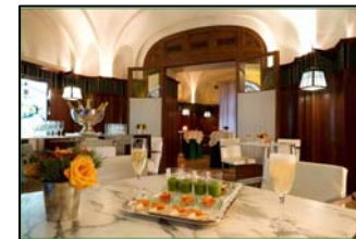
Entrée du 59 Poincaré et Lounge