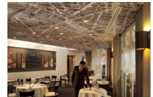
Restaurant Le Relais du Parc